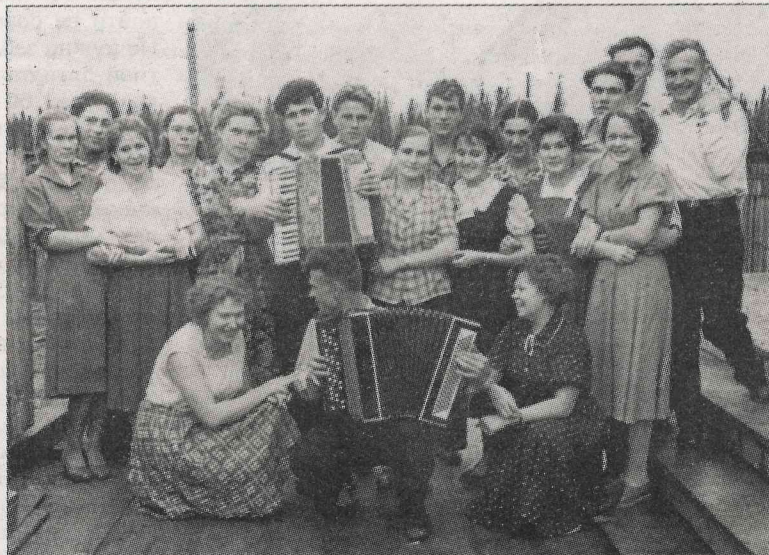
В кругу друзей в пос. Данилов Луг. Работали много, отдыхали весело.